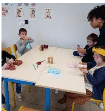
On a fabriqué un pompon-gland.