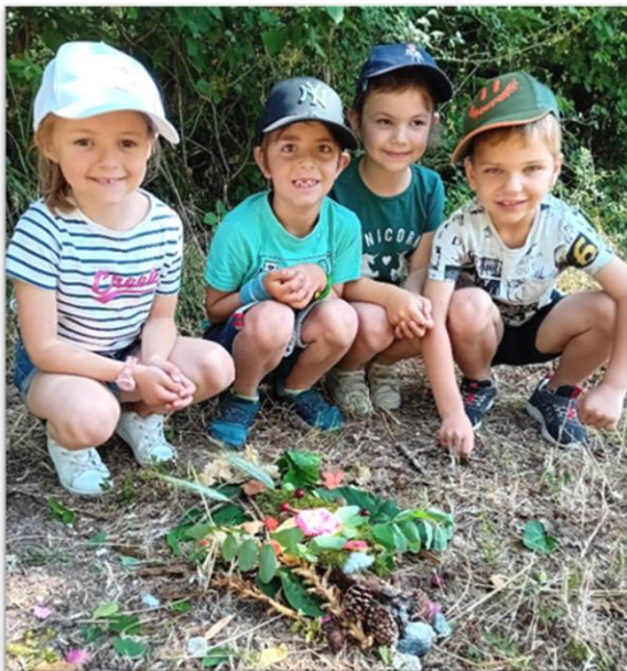
Prix de l'originalité