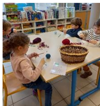
On a fabriqué un croisillon mexicain.