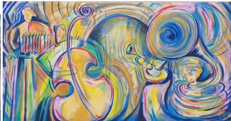
Installation des Grands Formats Printemps - Eté

Au cours de l'année, ont eu lieu 2 « Ateliers Déco » avec une quinzaine d'enfants. Le premier atelier sur le thème de Pâques où les enfants ont pu créer des petites cartes et des décorations à installer chez eux. Le second au mois de novembre pour préparer les décorations de Noël. Les enfants ont pu créer des étoiles de Noël que nous avons installées sur les fenêtres de la mairie ainsi que devant l'école. Les décorations des années précédentes sont réinstallées sur la place des commerces. Les enfants ont aussi créé des petites décorations en feutrine et fait un peu de couture. Merci aux enfants d'être toujours présents lors de ces moments et aux parents de nous faire confiance.