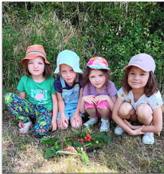
Prix de la poésie