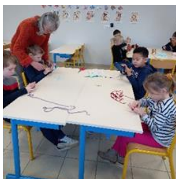
On a fabriqué un tricot de doigts.

Une intervention autour « des teintures végétales et de la laine » a eu lieu dans la classe des GS/CP. Les enfants ont préparé un bain de teinture végétale et réalisé une teinture sur laine. Ensuite, ils ont expérimenté différentes techniques liées à la préparation et à la transformation de la laine. Enfin, ils ont réalisé quelques fabrications en laine.